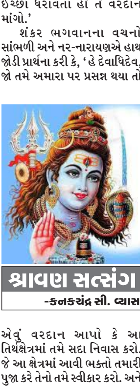
શ્રાવણ સત્સંગ -કનકચંદ્ર સી. વ્યાસ

પ્રાચીન કાળમાં ભગવાનના અંશાવાતર નર અને નારાયણે તપ કરવાની ભાવના સાથે બદરીકાવનમાં આશ્રમ બનાવ્યો. તેમણે ભગવાન શિવજીને પ્રાર્થના કરી કે, ‘આ સ્થળે તમે પાર્થિવ લિંગ સ્વરૂપે બીરાજો.’ ભગવાન શિવજીએ તેમની પ્રાર્થના સ્વીકારી અને નર-નારાયણ દ્વારા નિર્મિત શિવલીંગમાં પ્રવેશ કરી નિવાસ કર્યો. નર-નારાયણે પરમ શ્રદ્ધા સાથે શિવલીંગની ષોડશોપચારે પુજા કરી અને કદીન તપસ્યા કરવા લાગ્યા. તેઓ નિરાહર તથા જીતેન્દ્રીય રહીને રાત-દિવસ ભગવાન શિવજીનું ચિંતન કરતા હતા. તેમના જીવનમાં માત્ર એક જ કાર્ય રહ્યું હતું. આ પ્રકારે તપ કરતા કરતા ઘણો જ સમય વ્યતિત થઈ ગયો. ત્યારે ભગવાન શ્રી શિવજી સાક્ષાત પ્રગટ થઈને બોલ્યા, ‘હે નર-નારાયણ હું તમારી તપસ્યાથી અત્યંત પ્રસન્ન થયો છું. તમે જે